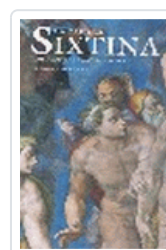
CAPILLA SIXTINA PFEIFFER, H.X