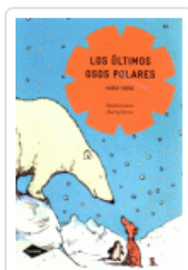
ULTIMOS OSOS POLARES, LOS (COMETA) HORSE, HARRY