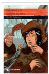
MARCABRU Y LA HOGUERA DE HIELO (CUATROVIENTOS) TEIXIDOR, EMILI