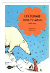
ULTIMOS OSOS POLARES, LOS (COMETA) HORSE, HARRY