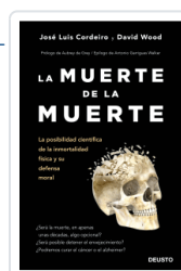
MUERTE DE LA MUERTE, LA CORDEIRO MATEO, JOSE LUIS / WOOD, DAVID