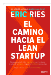
CAMINO HACIA EL LEAN STARTUP, EL RIES, ERIC