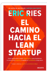
CAMINO HACIA EL LEAN STARTUP, EL RIES, ERIC