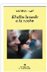
ALBA LA TARDE O LA NOCHE, EL REZA, Y