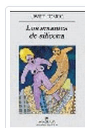
AMANTES DE SILICONA, LOS TOMEO, J