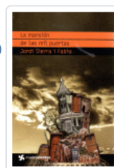
MANSION DE LAS MIL PUERTAS, LA (CUATROVIENTOS)