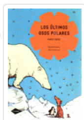
ULTIMOS OSOS POLARES, LOS (COMETA)