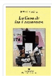
CASA DE LOS ENCUENTROS, LA AMIS, M