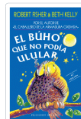
BUHO QUE NO PODIA ULULAR