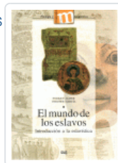
MUNDO DE LOS ESLAVOS, EL JAVIER, ENRIQUE/GARCIA, VERCHER