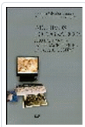
ARCHIVOS FOTOGRAFICOS:PAUTAS PARA UNA NTEGRACION DIGITAL SALVADOR BENITEZ, ANTONIA