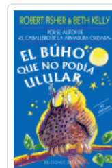
BUHO QUE NO PODIA ULULAR