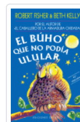
BUHO QUE NO PODIA ULULAR