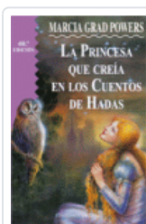
PRINCESA QUE CREIA EN CUENTOS DE HADAS