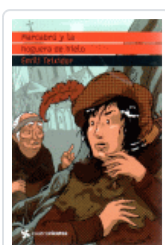
MARCABRU Y LA HOGUERA DE HIELO (CUATROVIENTOS) TEIXIDOR, EMILI