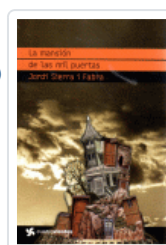
MANSION DE LAS MIL PUERTAS, LA (CUATROVIENTOS) SIERRA I FABRA, JORDI