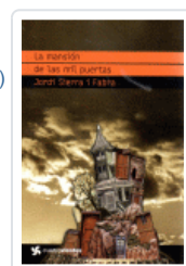
MANSION DE LAS MIL PUERTAS, LA (CUATROVIENTOS) SIERRA I FABRA, JORDI