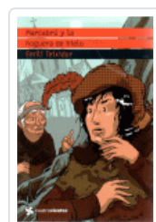
MARCABRU Y LA HOGUERA DE HIELO (CUATROVIENTOS) TEIXIDOR, EMILI