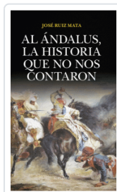
AL ÁNDALUS, LA HISTORIA QUE NO NOS CONTARON RUIZ MATA, JOSE