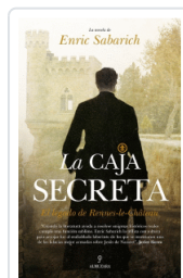
CAJA SECRETA, LA SABARICH, ENRIC