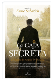
CAJA SECRETA, LA SABARICH, ENRIC