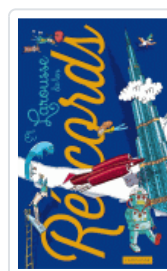
LAROUSSE DE LOS RECORDS VV.AA.