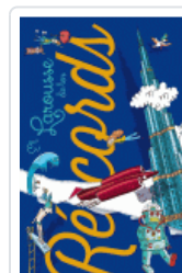
LAROUSSE DE LOS RECORDS VV.AA.