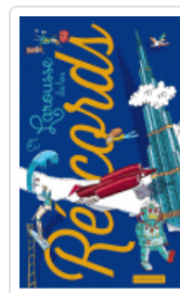
LAROUSSE DE LOS RECORDS VV.AA.