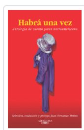
HABIA UNA VEZ VARIOS