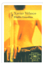
DIABLO GUARDIAN VELASCO, X.