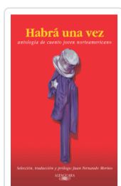
HABIA UNA VEZ VARIOS