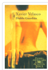
DIABLO GUARDIAN VELASCO, X.