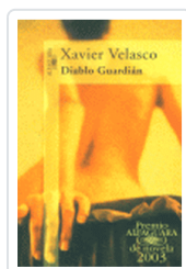
DIABLO GUARDIAN VELASCO, X.