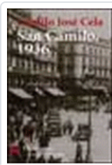
VISPERAS, FESTIVIDAD Y OCTAVA DE SAN CAMILO DEL AÑO 1936 EN CELA, CAMILO JOSE