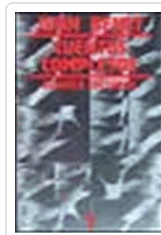
CUENTOS COMPLETOS 1 (BENET) BENET