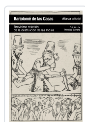
BREVISIMA RELACIÓN DE LA DESTRUCCIÓN DE LAS INDIAS Las Casas, Bartolomé de