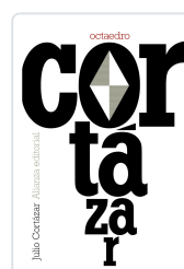
OCTAEDRO Cortázar, Julio