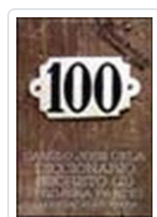
DICCIONARIO SECRETO 2. 1ª PARTE CELA