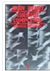
CUENTOS COMPLETOS 1 (BENET) BENET