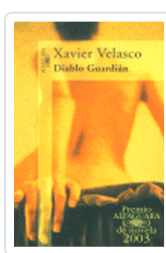
DIABLO GUARDIAN VELASCO, X.