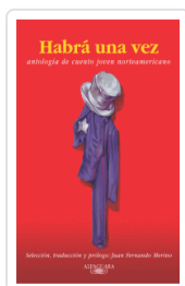
HABIA UNA VEZ VARIOS