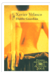
DIABLO GUARDIAN VELASCO, X.