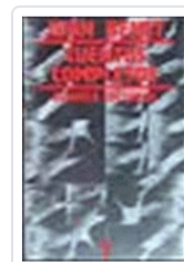
CUENTOS COMPLETOS 1 (BENET) BENET