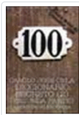
DICCIONARIO SECRETO VOL.2 (CELA) CELA, CAMILO J.