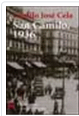
VISPERAS, FESTIVIDAD Y OCTAVA DE SAN CAMILO DEL AÑO 1936 EN CELA, CAMILO JOSE