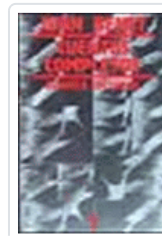
CUENTOS COMPLETOS 1 (BENET) BENET