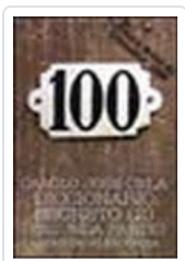
DICcionario SECRETO VOL.2 (CELA) CELA, CAMILO J.