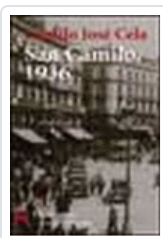
VISPERAS, FESTIVIDAD Y OCTAVA DE SAN CAMILO DEL AÑO 1936 EN CELA, CAMILO JOSE