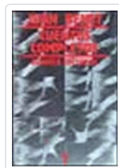
CUENTOS COMPLETOS 1 (BENET) BENET