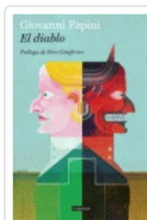
DIABLO, EL (BACKLIST) PAPINI, GIOVANNI