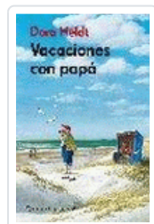
VACACIONES CON PAPA HELDT, DORA