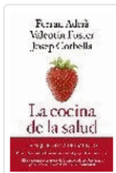
COCINA DE LA SALUD, LA (6ªED) VV.AA.