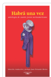
HABIA UNA VEZ VARIOS