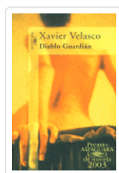
DIABLO GUARDIAN VELASCO, X.