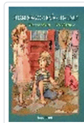
CUANDO YO TENIA TU EDAD