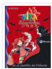
KIKA SUPERBRUJA EN CASTILLO D DRACULA 10