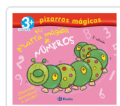
TU PIZARRA MÁGICA DE NÚMEROS RASHLEIGH, CAROLINE